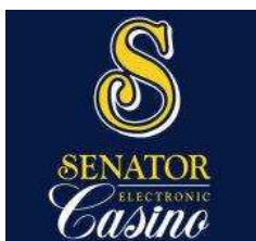
Adria Casino d.o.o.